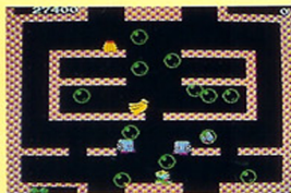
アワを吐いて敵をやっつけろ！