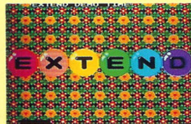
エクステンドショーで1UP！