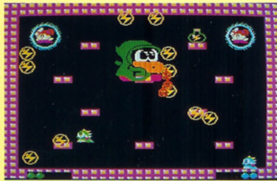
こいつは2人でやっつけた方が...??